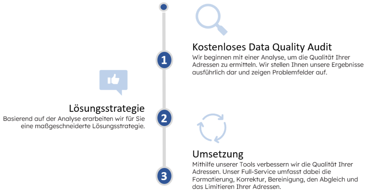
Abbildung: Schritt für Schritt zur optimalen Adressqualität

Unser Full-Service ermöglicht eine unkomplizierte und effiziente Verbesserung Ihrer Adressqualität: