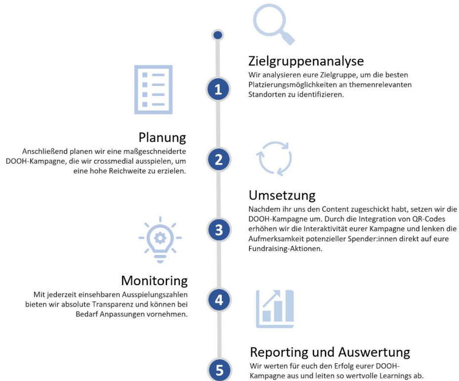
Abbildung: Die 5 Schritte für eure DOOH-Kampagne

Unser strategischer und systematischer Ansatz gewährleistet eine optimale DOOH-Kampagne: