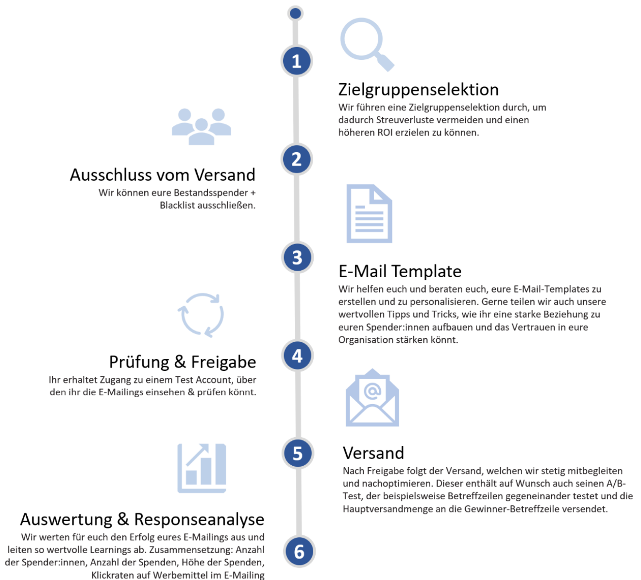
Abbildung: Schritt für Schritt zu eurer E-Mail-Kampagne

Die Ergebnisse der Kampagne bereiten wir auf und besprechen diese mit euch. Dazu gehört beispielsweise die Auswertung vereinbarter Kennzahlen (z. B. Öffnungsrate) und die Analyse des Klickverhaltens auf Basis unseres visuellen Klickreports.