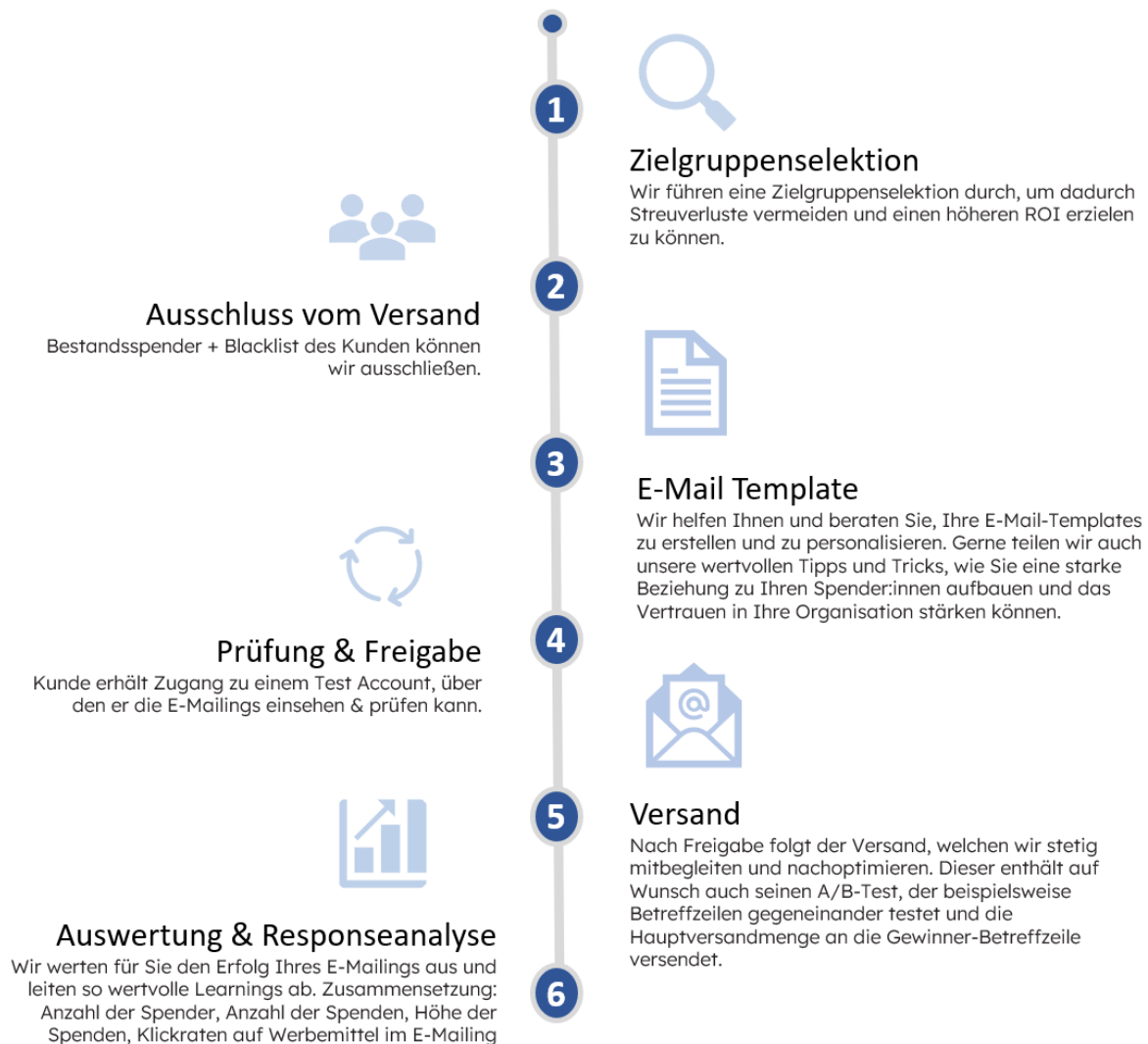
Abbildung: Schritt für Schritt zu Ihrer E-Mail-Kampagne

Gemeinsam mit Ihnen planen wir die einzelnen Schritte zur Umsetzung Ihrer E-Mail-Kampagne. Dazu gehört auch die Entwicklung geeigneter Testszenarien, z. B. für Betreffzeilen oder Call-to-Actions.