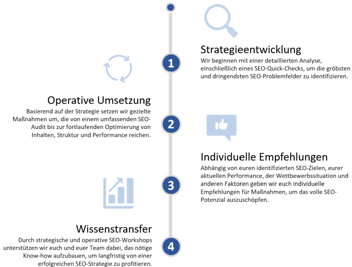
Abbildung 2: Schritt für Schritt zur suchmaschinenoptimierten Seite

Unser strategischer und systematischer Ansatz gewährleistet eine optimale Suchmaschinenoptimierung: