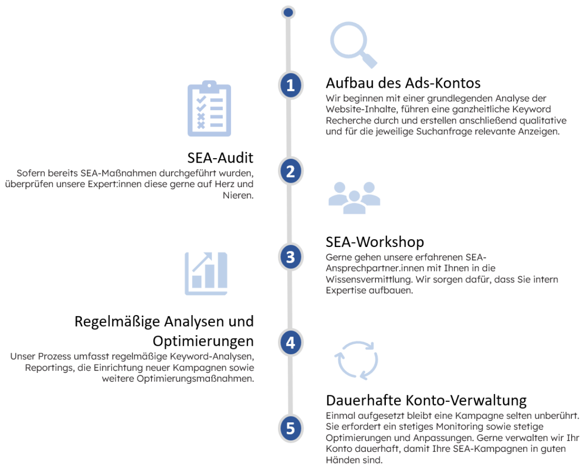
Abbildung 1: Unsere Strategie für Ihr SEA

Unser strategischer und systematischer Ansatz gewährleistet eine optimale Ausgangsposition: