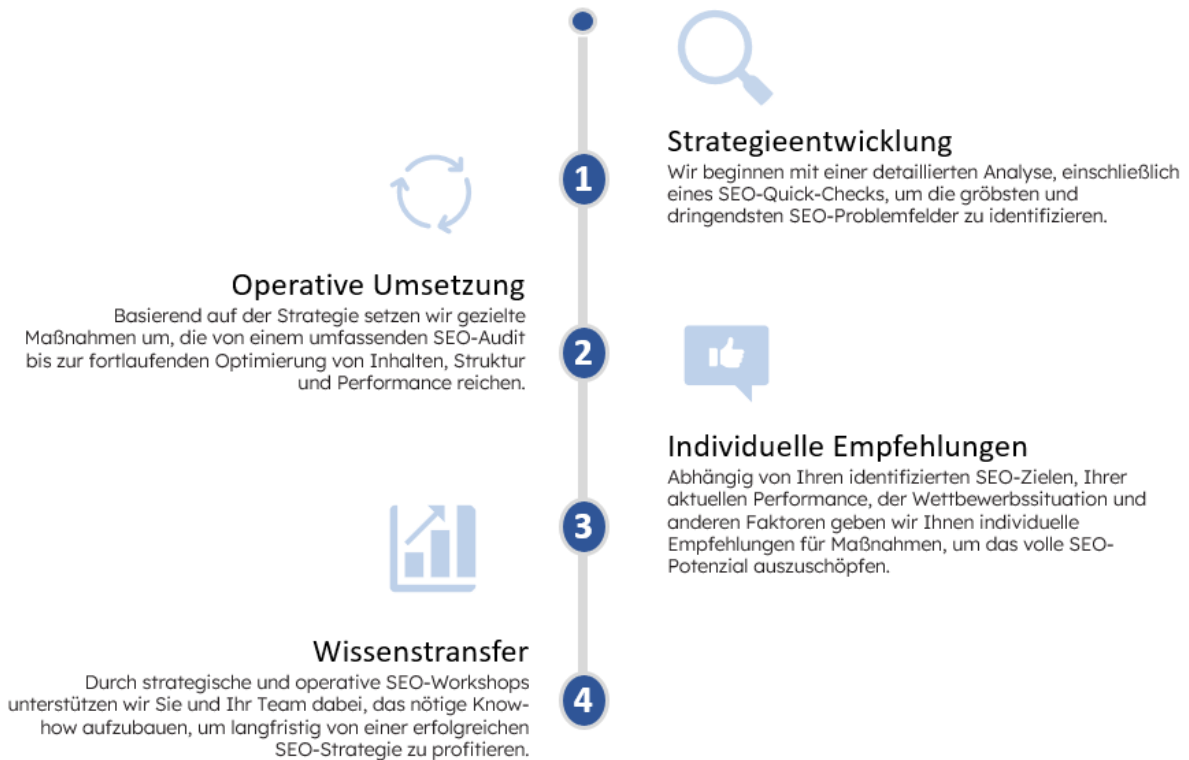
Abbildung 2: Schritt für Schritt zur suchmaschinenoptimierten Seite

Unser strategischer und systematischer Ansatz gewährleistet eine optimale Suchmaschinenoptimierung: