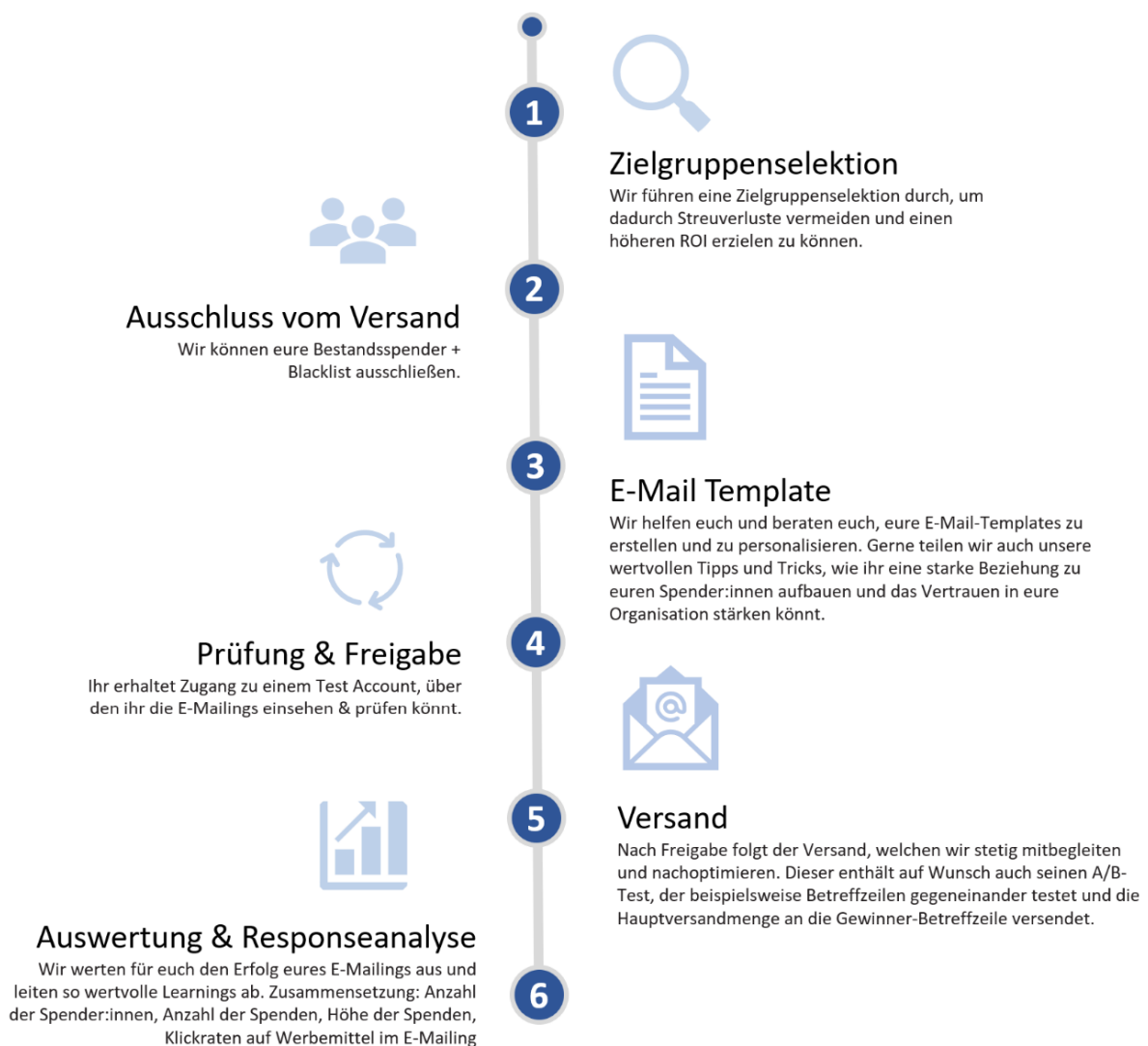
Abbildung: Schritt für Schritt zu eurer E-Mail-Kampagne

Gemeinsam mit euch planen wir die einzelnen Schritte zur Umsetzung eurer E-Mail-Kampagne. Dazu gehört auch die Entwicklung geeigneter Testszenarien, z. B. für Betreffzeilen oder Call-to-Actions.